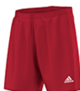
SHORT PARMA 16 ROUGE/BLANC