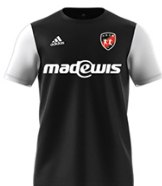
MAILLOT ESTRO 19: NOIR/BLANC