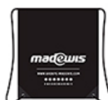
SAC A CHAUSSURE