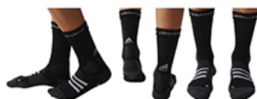
CHAUSSETTES SPORT CO NOIRE